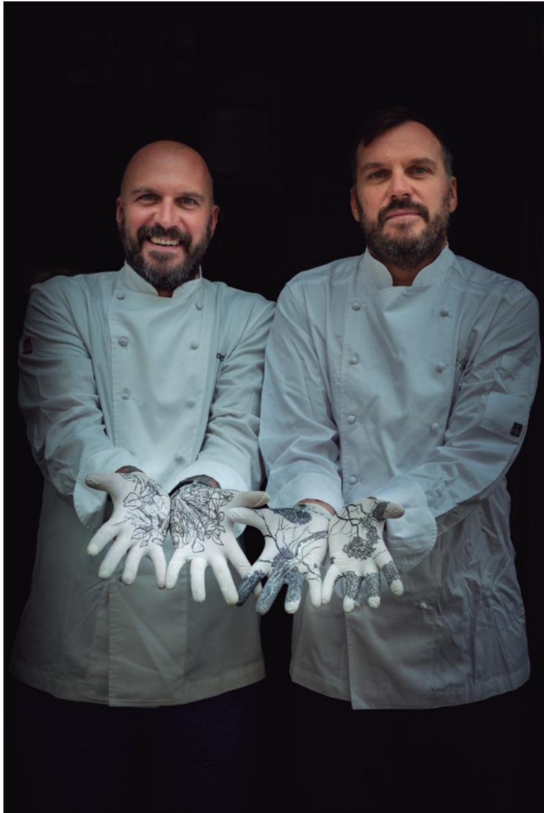
Germans Colombo Xefs | Restaurant Xemei