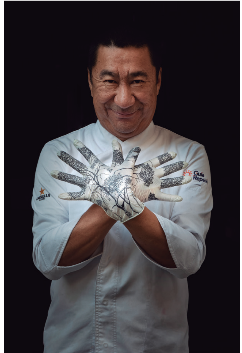
Josep Maria Kao Xef | Restaurant Shanghai