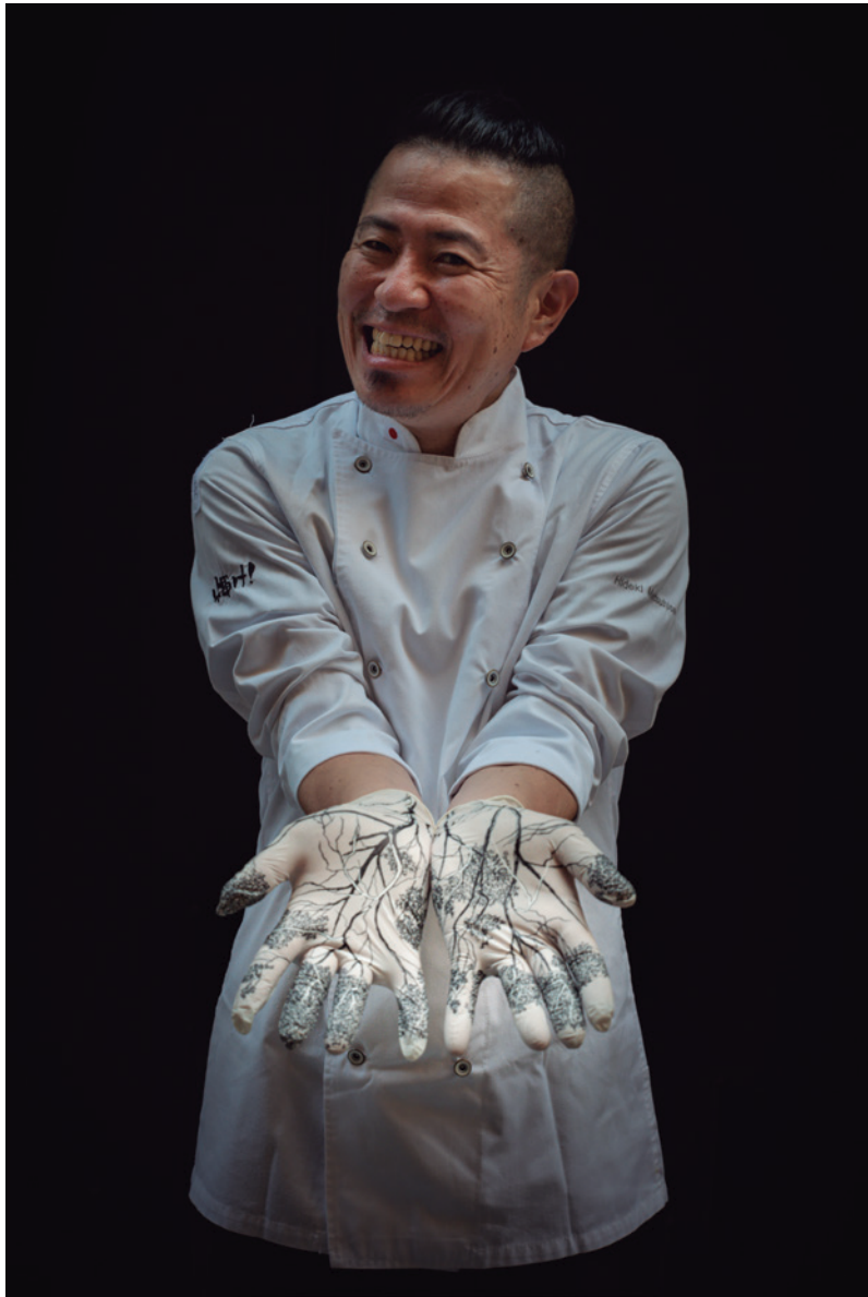
Hideki Matsuhisa Xef | Restaurant Koy Shunka