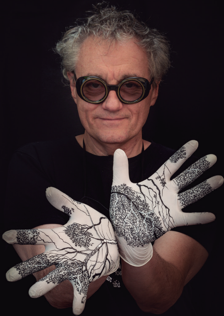
Christian Escribà Patisser | Patisserie Escribà