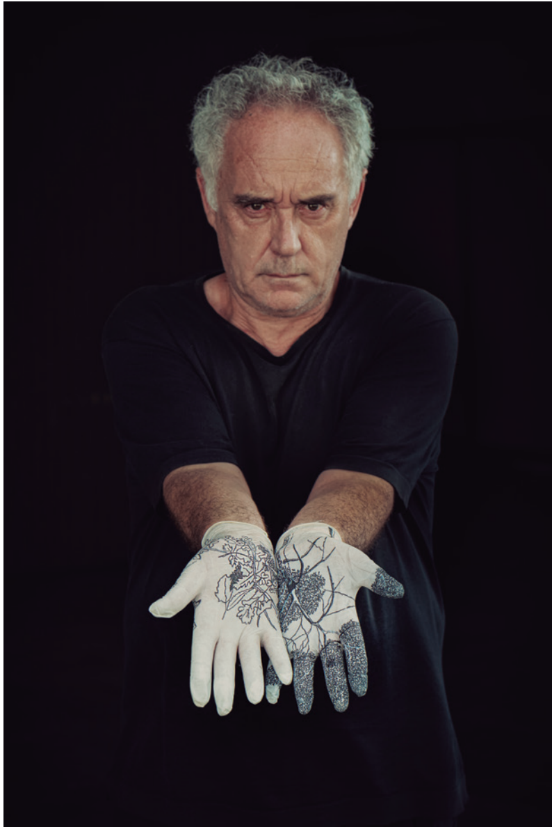
Ferran Adrià Xef i pensador | Restaurant El Bulli